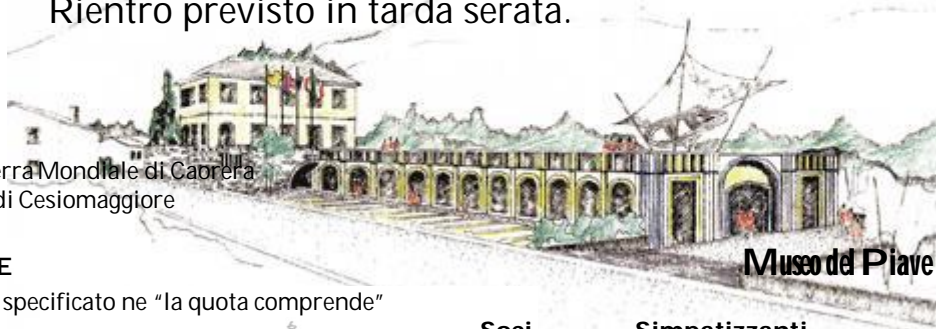
Museo del Piave

Extra personali e tutto quanto non specificato ne "la quota comprende"