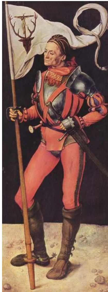
Sant'Eustachio, a Monaco di Baviera

La mostra racconta , attraverso testi rigorosamente scientifici e immagini accattivanti, la storia della città, scandita per temi, dalla fondazione alla splendida Basilica del patriarca Popone. Alla scoperta dei colori dei mosaici, delle ambre, dei gioielli, delle gemme incise, cui si aggiungono calchi di importantissimi documenti epigrafici e figurati appartenenti al Museo Archeologico Nazionale, fondato nel 1882 e inaugurato dall'arciduca Karl Ludwig, in rappresentanza dell'imperatore Franz Joseph.